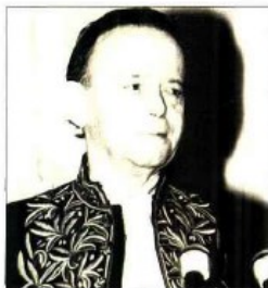
Jacques Laurent en costume d'académicien. Il est reçu Quai Conti en 1986, après avoir obtenu le prix Goncourt pour son livre Les Bêtises , en 1971.

On ne retiendra ici que la première, dans ses rapports avec une œuvre aussi considérable qu'inégale et variée. Riche, ou plutôt encombrée de quelque 70 titres, la postérité, on peut le présumer, n'en retiendra qu'une partie. Dans la trentaine de livres signés Jacques Laurent, vingt ou vingt-cinq constituent la part solide de l'œuvre, la création véritable du grand écrivain que fut Laurent, celle sur laquelle s'est construite sa réputation et la carrière qui devait le conduire à l'Académie, aux côtés de ses amis Déon, Mohrt et Marceau. Dans la quarantaine de titres signés Saint-Laurent, dont beaucoup méritent un oubli pudique, tout n'est pas à rejeter, même Caroline chérie trop célèbre et trop décisif dans la vie de l'auteur pour disparaître complètement (conçoit-on Dumas sans les Mousquetaires ?). Mais Prénom Clotilde et sa suite, la série Hortense 14-18 ou Les Passagers pour Alger , en dépit d'une rédac-