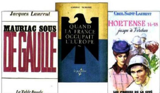
Cecil Saint-Laurent rencontra un immense succès après du public avec Caroline chérie , Hortense 14-18 ou Les Passagers d'Alger . Mais ce romancier populaire fut aussi un brillant polémiste et son Mauriac sous De Gaulle lui valut les foudres du pouvoir de l'époque. C'est sous le pseudonyme d'Albéric Varenne qu'il évoque l'occupation napoléonienne de l'Europe.

Acquis aux idéaux de la Révolution nationale, le jeune Jacques Laurent compte en 1944 parmi les réprouvés du moment