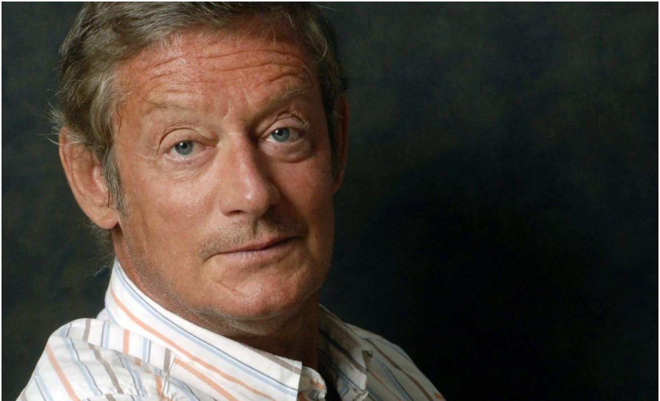
François Cérésa. Numéro de reportage : 10000964_000001