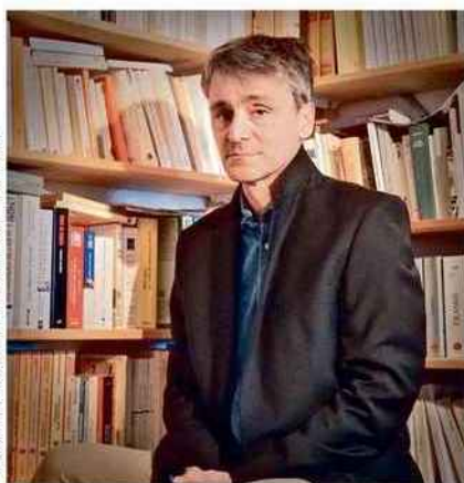
PRESSE/ÉDITIONS PIERRE-GUILLAUME DE ROUX